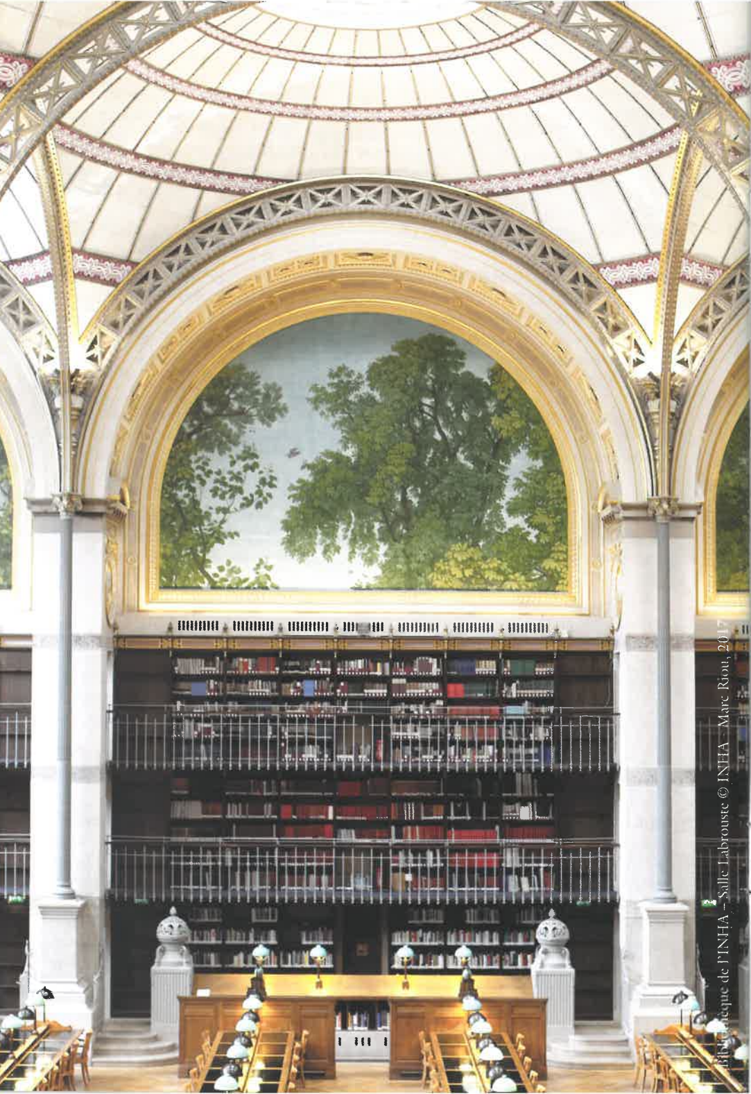
Bibliothèque de l'INHA - Salle Labrousse