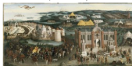
Art history Computer Sciences