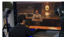
Cognitive psychology Computer Science