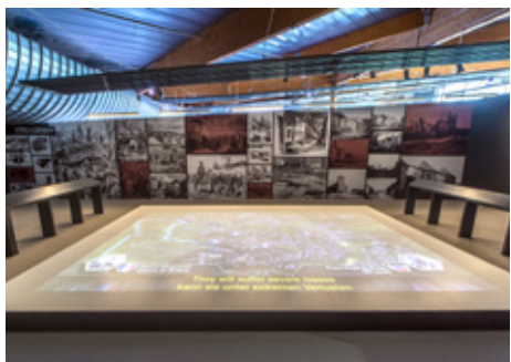
02 > Musée Guerre et paix en Ardennes (08)