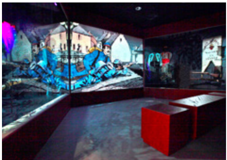
03 > Musée de la Guerre 1870 de Loigny-la-Bataille (28)