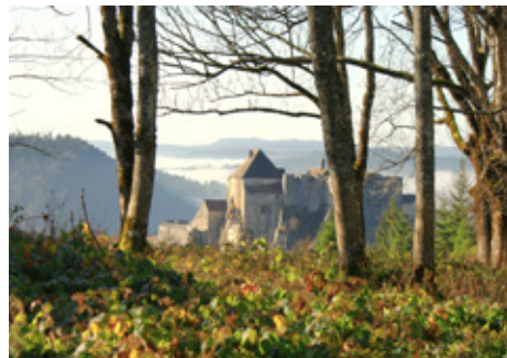
04 > Musée de Pontarlier-Château de Joux (25)