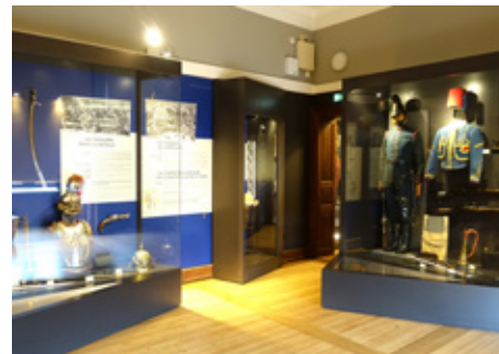
06 > Woerth Musée de la bataille du 6 août 1870 (67)