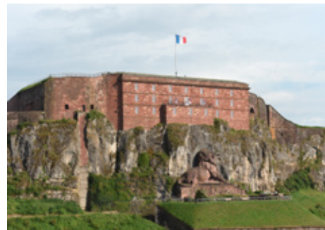
05 > Musée et Citadelle de Belfort (90)