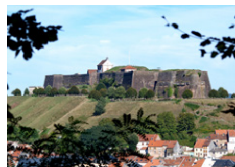
07 > Citadelle de Bitche (57)