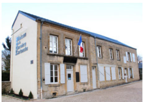
01 > Musée de la Maison de la dernière cartouche de Bazeilles (08)