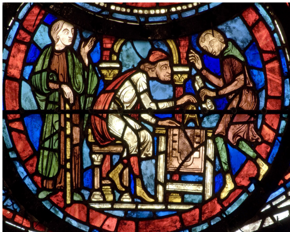
L'architecte à sa table à dessin. Vitrail dans le style du début du XIII e siècle. Panneau n° 10 de la baie n° 38 de la cathédrale de Chartres, créé par Charles Lorin en 1927 © S. Whatling.

C'est, en réunissant les spécialistes dont les travaux dispersés ont contribué à renouveler la question, l'objectif que se sont assigné les organisateurs de cette journée d'études, qui marque aussi le lancement d'un projet de base de données des dessins d'architecture gothiques français.