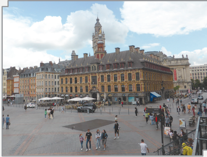
PLACE DU GÉNÉRAL DE GAULLE, LILLE, FRANCE