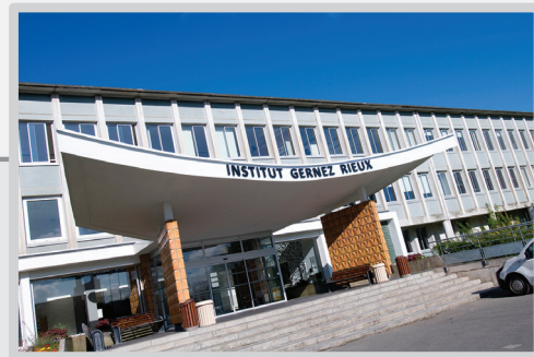
PLAN D'ACCÈS À L'INSTITUT GERNEZ-RIEUX