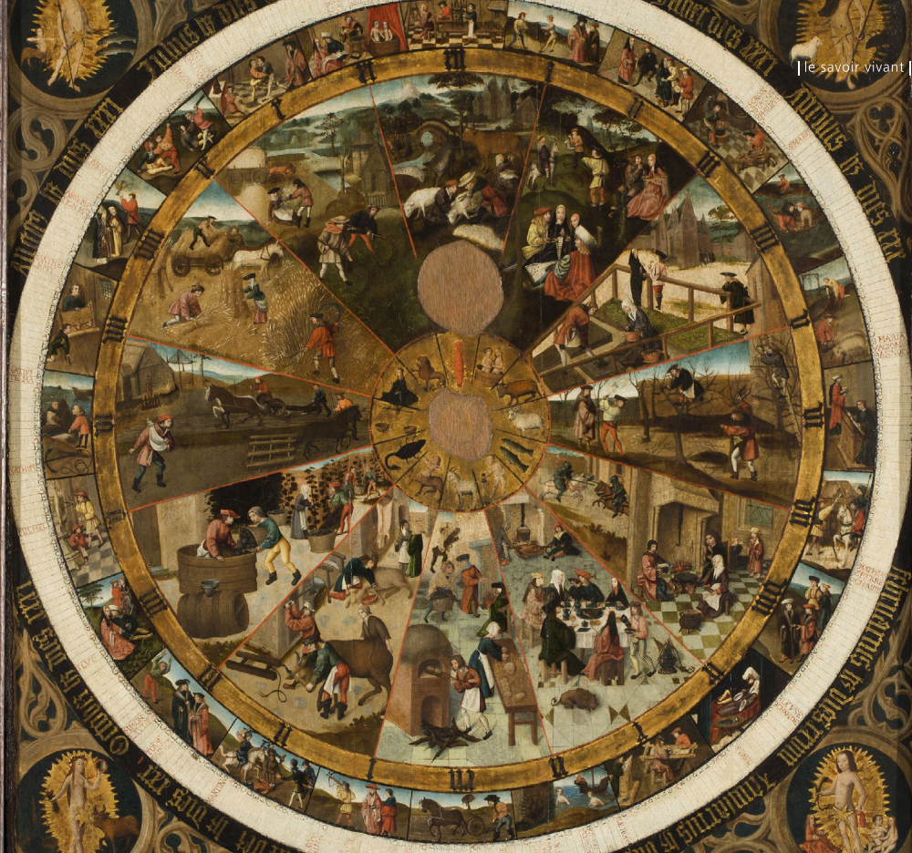
Jan Massys (?), Plateau-calendrier , v. 1490-1510, huile sur bois, 122 cm (diamètre), M-Museum Leuven